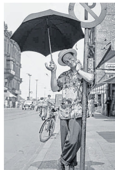
Wer ist der Mann auf dem von Foto, das Pit Steiger 1953 schoss?

Steiger, 1986 nach längerer Krankheit gestorben, hat damals für zahlreiche Zeitungen der Region fotografiert. Doch wen er da als Symbol für den Hitzesommer, aber – so der Bildtext – auch die manchmal trotz strahlendem Sonnenschein auftretende Regenfälle ablichtete, war in