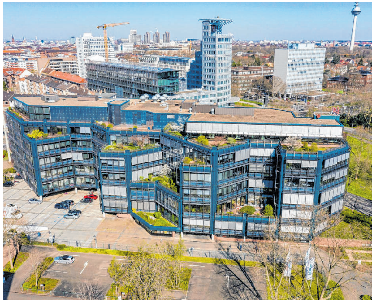
Das Koros-Bürogebäude am östlichen Stadteingang wird derzeit aufwendig im Innern umgebaut und saniert. Jetzt ist ein erster Mieter eingezogen.

Das Koros bietet große Flexibilität bezüglich der Flächennutzung, die das Heidelberger Unternehmen für die komplexen Bedürfnisse eines internationalen Biotech-Unternehmens benötigt, so der Activum-Sprecher auf Nachfrage der Redaktion. Die geräumigen Etagen ermöglichen offene Strukturen für optimale Kommunikation, und gleichzeitig könne ein Teilbereich als biotechnologisches Labor ausgebaut werden. Insgesamt verfügt das Koros-Bürogebäude über eine Mietfläche